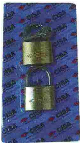
10546 CS-CANDADO IGUALADO 50mm